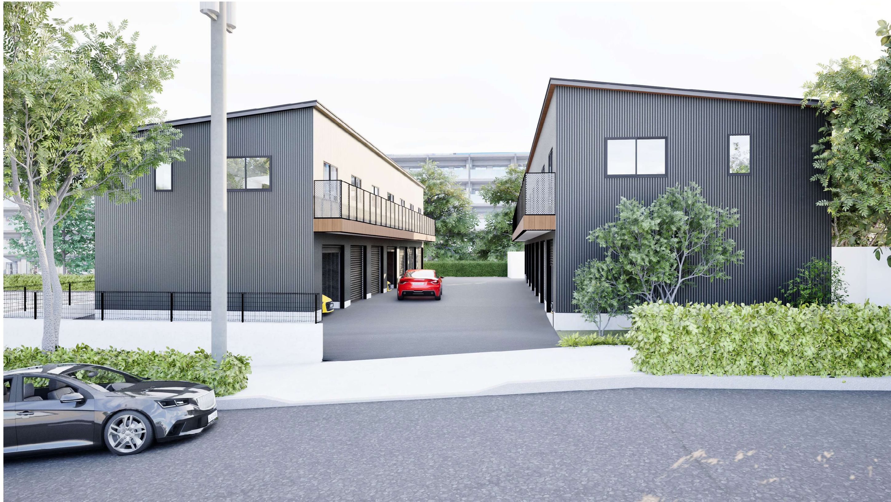
スパンドレル 金属系外壁全景 実際は隔て板があります