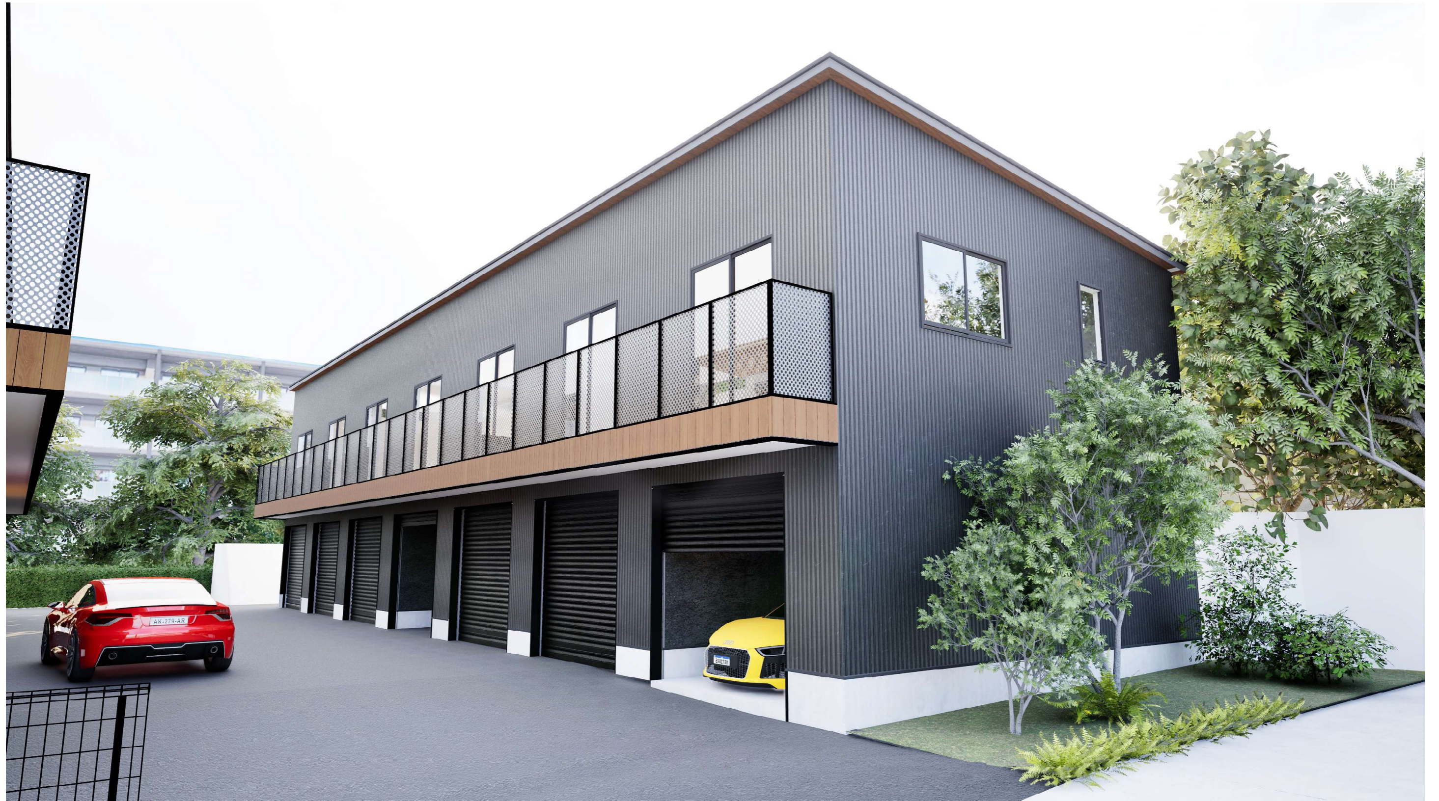
スパンドレル 金属系外壁 実際は隔て板があります