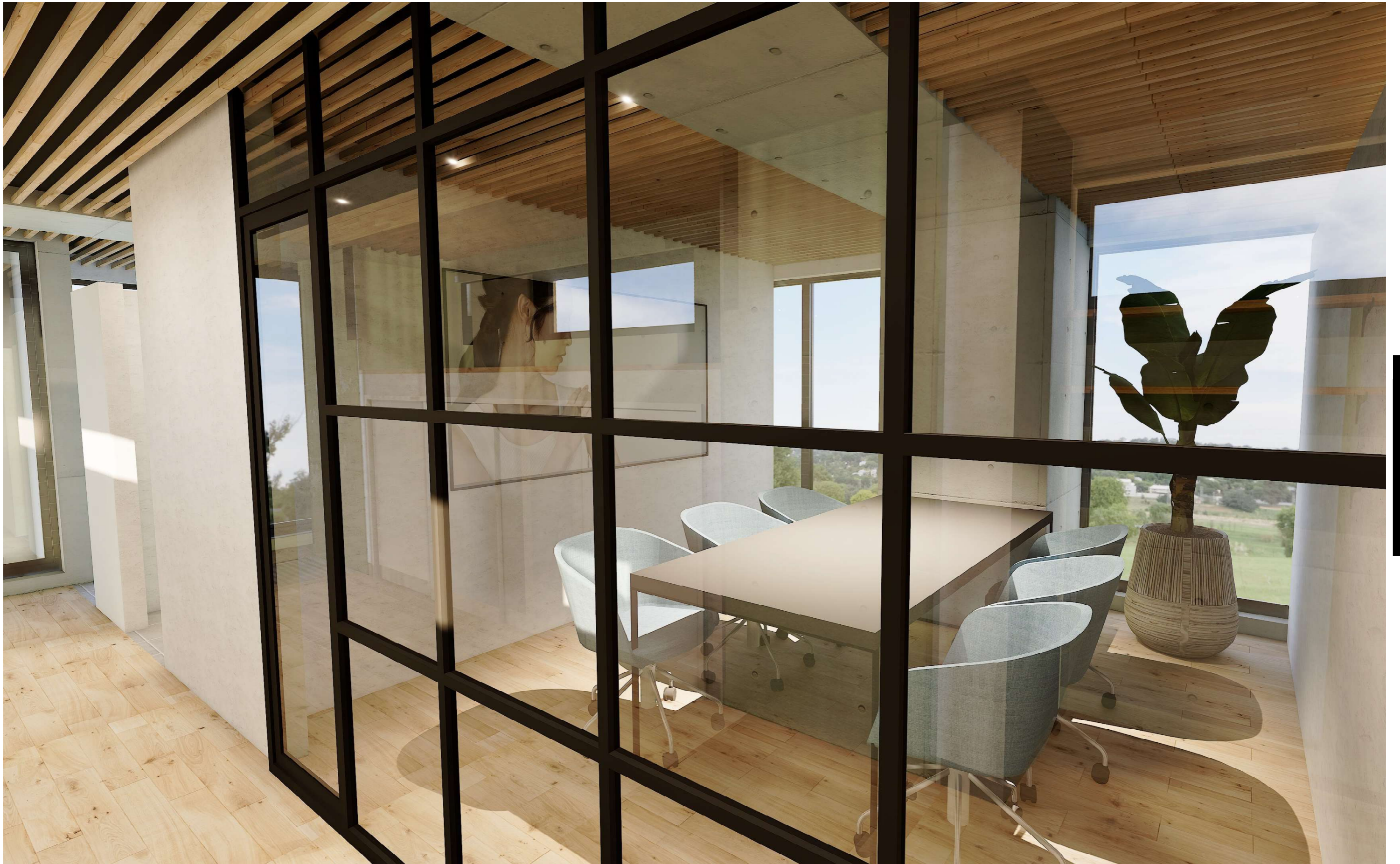
Meetings Private rooms