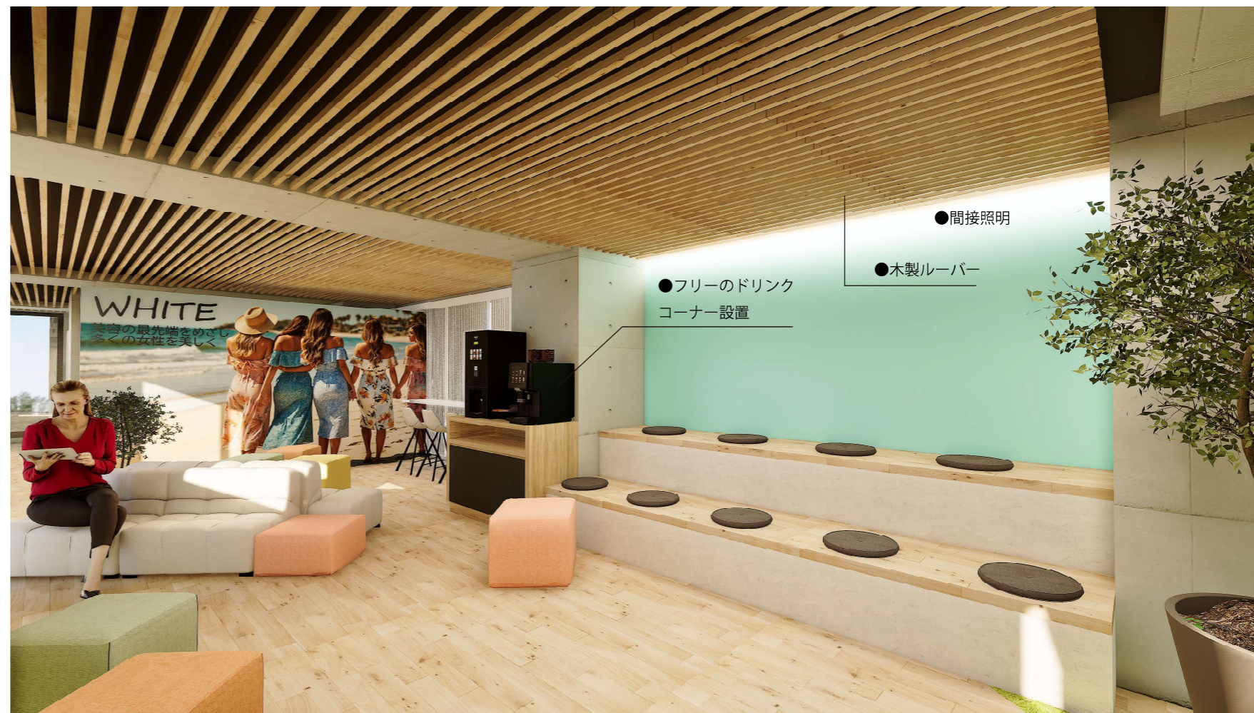
●フリーのドリンク コーナー設置