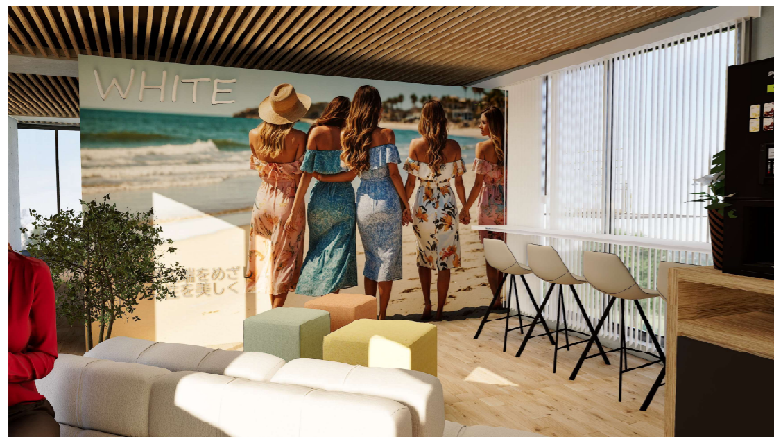
●入口から正面に見える大きな壁はグループを印象付ける写真や キャッチコピーをレイアウトする。