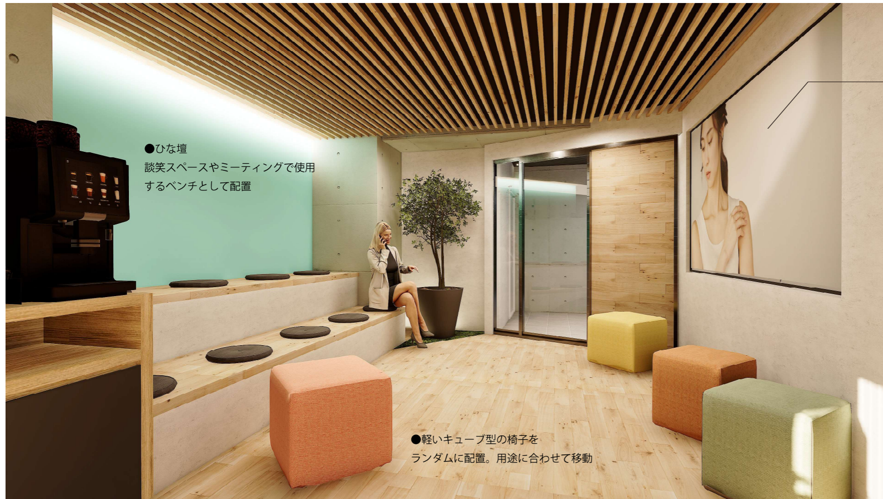
●ひな壇 談笑スペースやミーティングで使用 するベンチとして配置