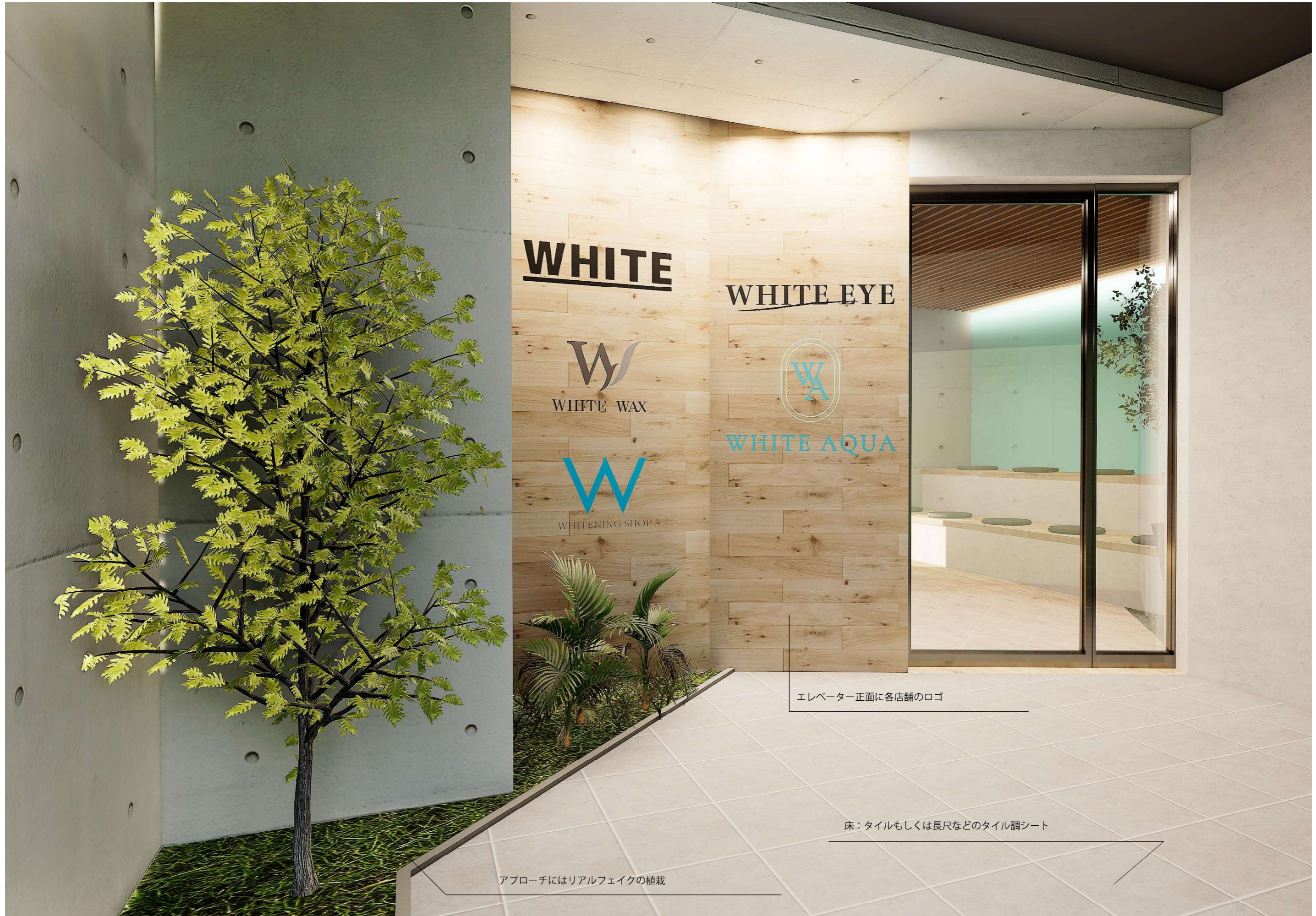
エレベーター正面に各店舗のロゴ